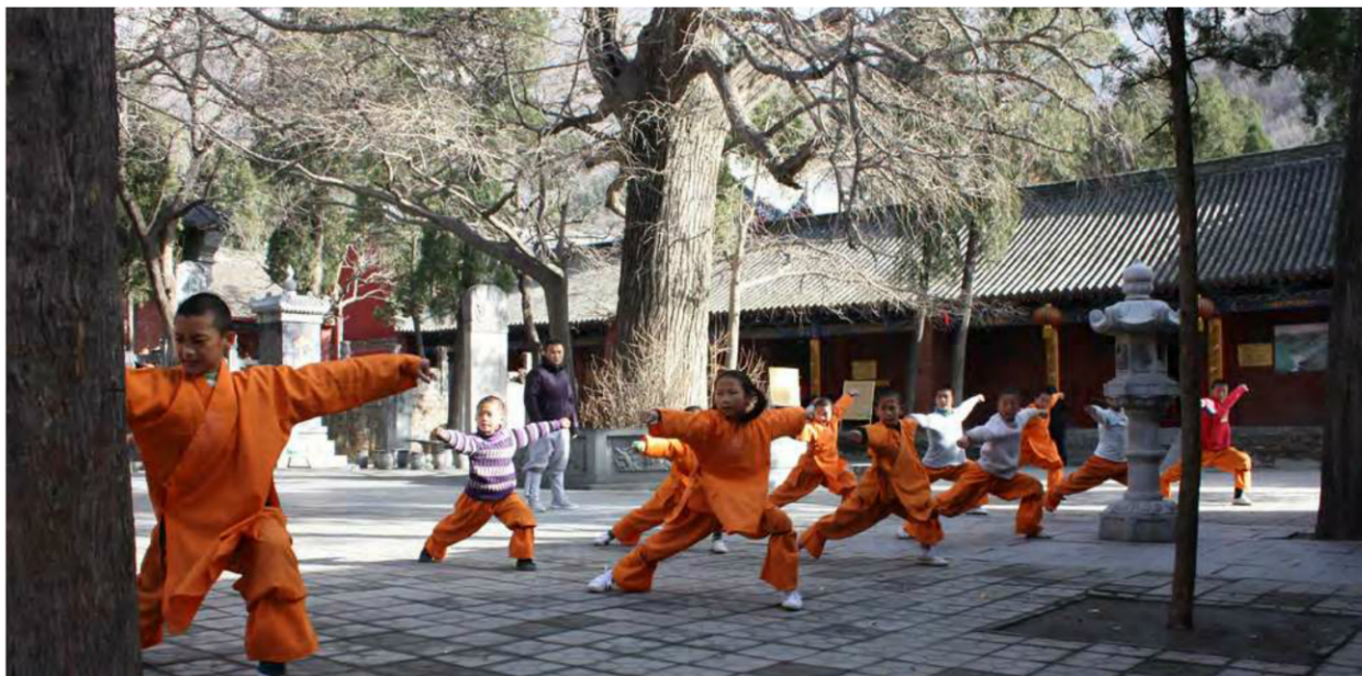
习练咏春拳的孩子们 Un grupo de niños aprenden Wing Chun en una academia.

hoy son practicadas en todos los continentes. Al principio su negocio no fue demasiado próspero. En la gran ciudad había mucha competencia y no era fácil sobresalir en un entorno en el cual había grandes escuelas ya arraigadas al territorio con experimentados e incluso famosos maestros. Pero dos hechos dieron a las lecciones de este cantonés el empujón para convertirse en leyenda. El primero es su el trato que daba a sus pupilos. Ip Man enseñaba a todos sus estudiantes de manera diferente, dependiendo de su habilidad natural, la personalidad y la comprensión de cómo sentía que el Wing Chun se adaptaría mejor a ellos. Su alumno estrella Bruce Lee inmortalizaría este concepto en la famosa frase “Be water my friend / Sé agua, amigo mío”. En el fondo el actor utiliza esta metáfora para definir uno de los conceptos básicos de ese Wing Chun. Es mejor no tener forma definida (adaptarse a las circunstancias). Así, el agua tiene forma de botella cuando