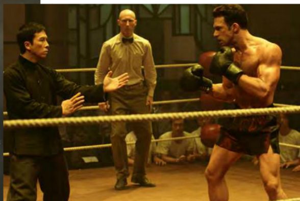
电影《叶问2》中的场景及海报 Escenas y cartel de la película Ip Man 2.