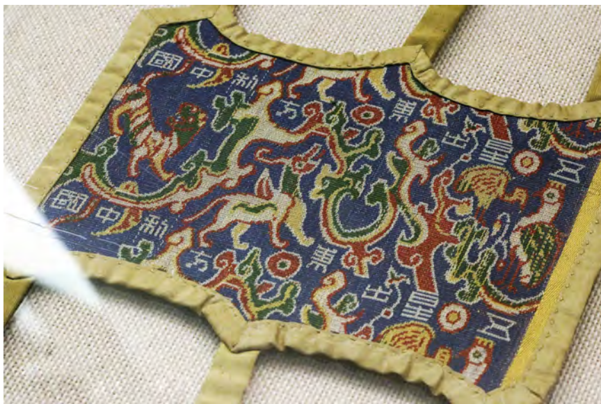
1995年出土的汉代蜀锦“五星出东方利中国” Brocado Cinco estrellas saliendo del oriente de la dinastía Han desenterrado en 1995

最初，蜀绣主要流行于民间，川西农村几乎是“家家女红、户户针工”，后来逐渐形成行业。到宋代时，蜀绣之名已遍及神州，文献称蜀绣技法“穷工极巧”。蜀绣把中国的刺绣工艺推上了巅峰。纯手工刺绣的蜀绣常以自然界为主题，如花鸟、山川等，造型多变，图案精美，画面逼真、蜀绣的针法有十二大类，交错使用，变化多端，绣物生动传神，既长于刺绣花鸟虫鱼等细腻工笔，又善于表现气势磅礴的山水图景。比如北京人民大会堂四川厅的巨幅“芙蓉鲤鱼”座屏、蜀绣名品“蜀宫乐女演乐图”挂屏和双面异色的“水草鲤鱼”座屏就是蜀绣中的代表作。■