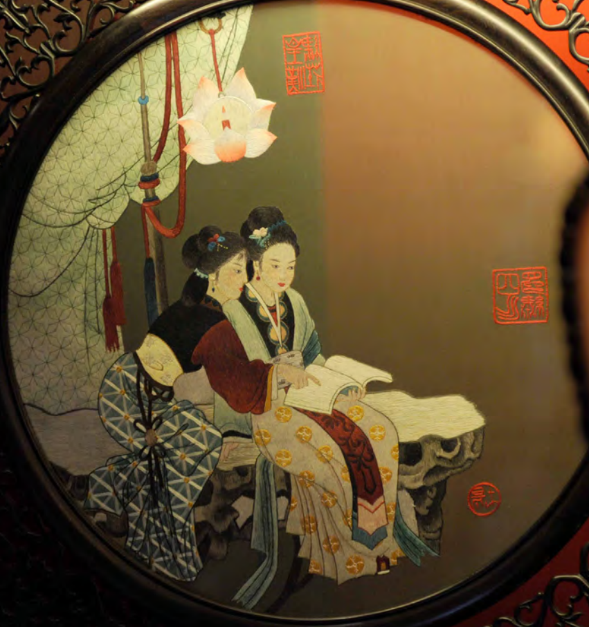
四川成都蜀锦蜀绣工厂内陈列的一件蜀绣作品 Una obra de Bordado Shu en una fábrica de Brocado y Bordado Shu en Chengdu, provincia de Sichuan

El brocado y el bordado Shu, conocidos como “tesoro oriental y técnica única de China” datan de hace más de dos milenios y son patrimonio cultural inmaterial de China.