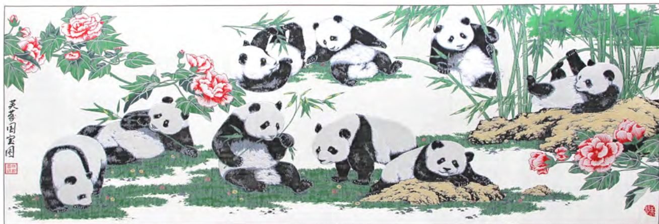
熊猫图案的典型蜀锦作品 Típico brocado con imágenes de oso panda