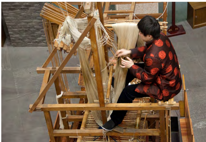
织造蜀锦的织锦机 Telar donde se realizan brocados con seda

la dinastía Han. También están tejidos los caracteres 五星出东方利中国. Aunque han pasado más de mil años, sigue siendo un brocado muy colorido y bello.